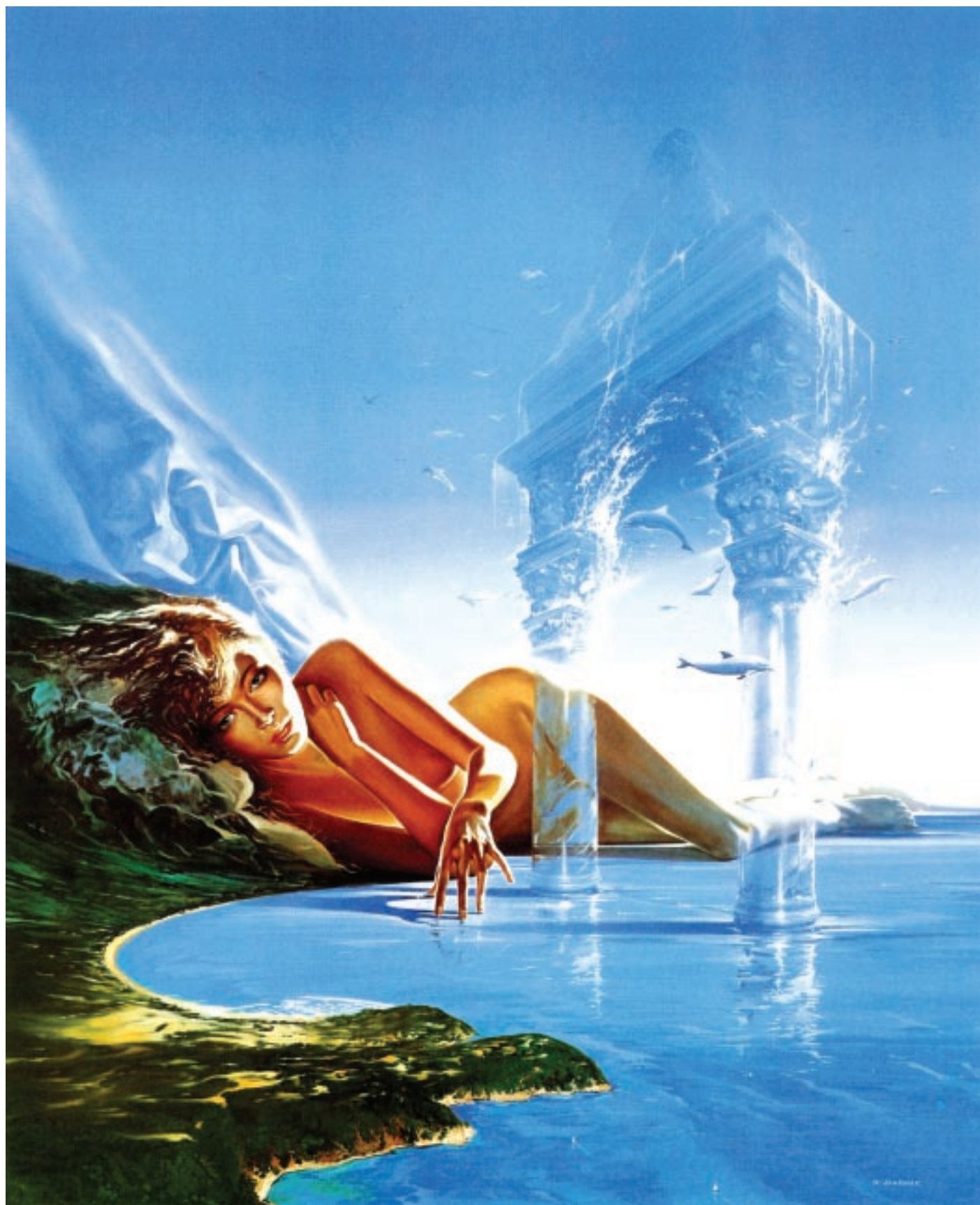
W. Siudmak - „Zatoka Gracji”. Olej na płótnie.