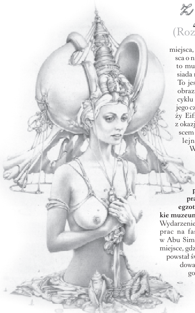
rys. W. Siudmak - „Dziwny sen”