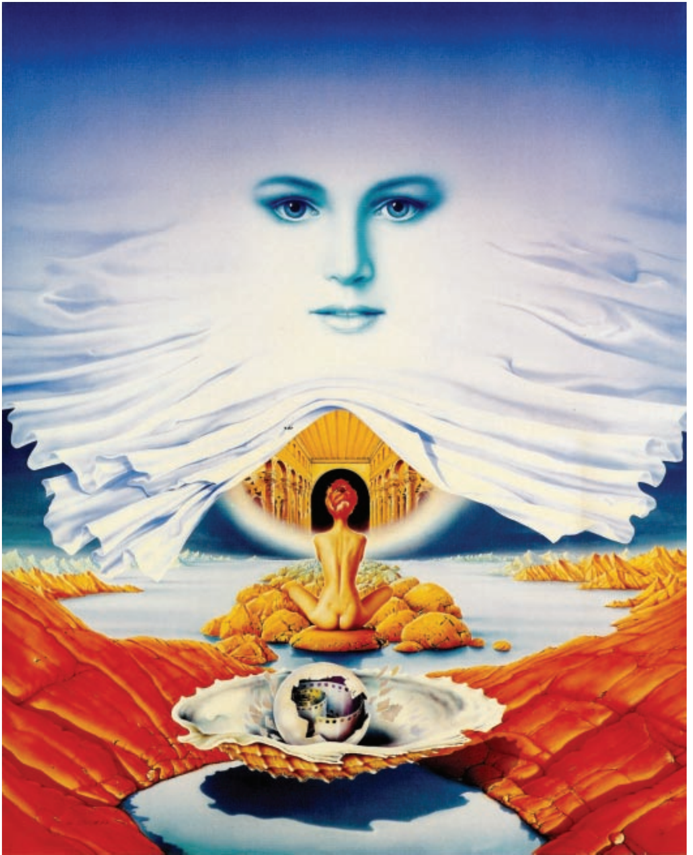
W. Siudmak - „Nierealne objawienie się Muzy”. Olej na płótnie.