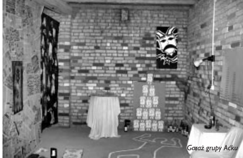
Garaż grupy Aćku