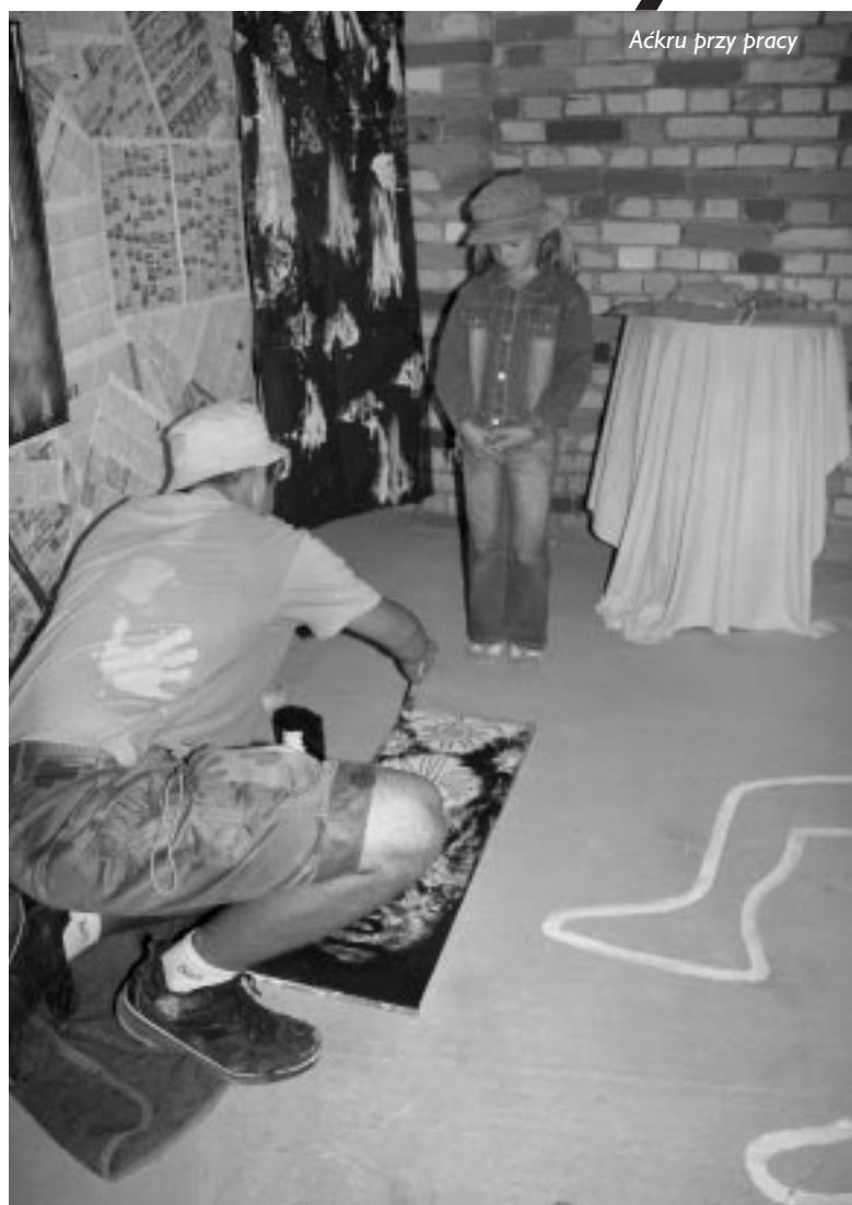
Aćkru przy pracy