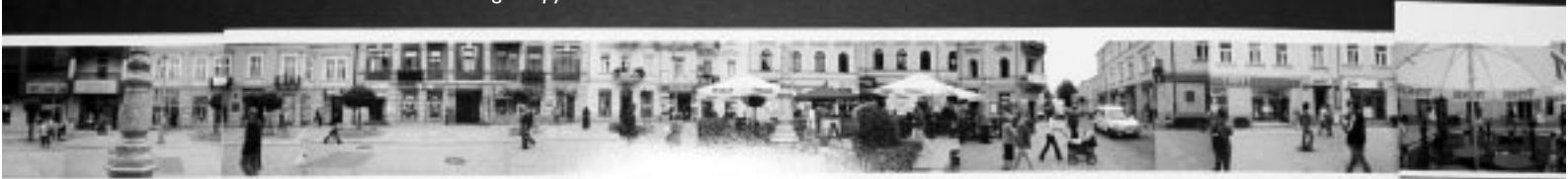
Panorama ul. Sienkiewicza w Kielcach wg Grupy CKF