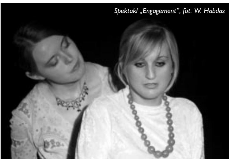
Spektakl „Engagement”