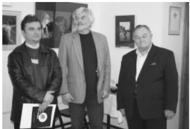
Wernisaż wystawy pokonkursowej „Człowiek i jego sztuka”.

Projekt dofinansowany przez Ministerstwo Kultury i Dziedzictwa Narodowego w ramach Narodowego Programu Kultury „ Znaki Czasu ”.