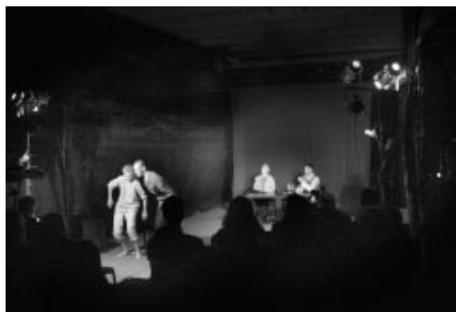
Spektakl „ Stópklatka ” kieleckiego Jazz Clubu.