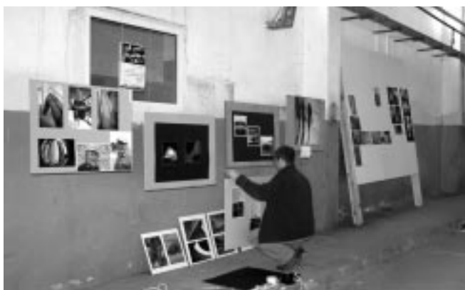
Akcja „Galeria Bezdomna” w Bazie Zbożowej.