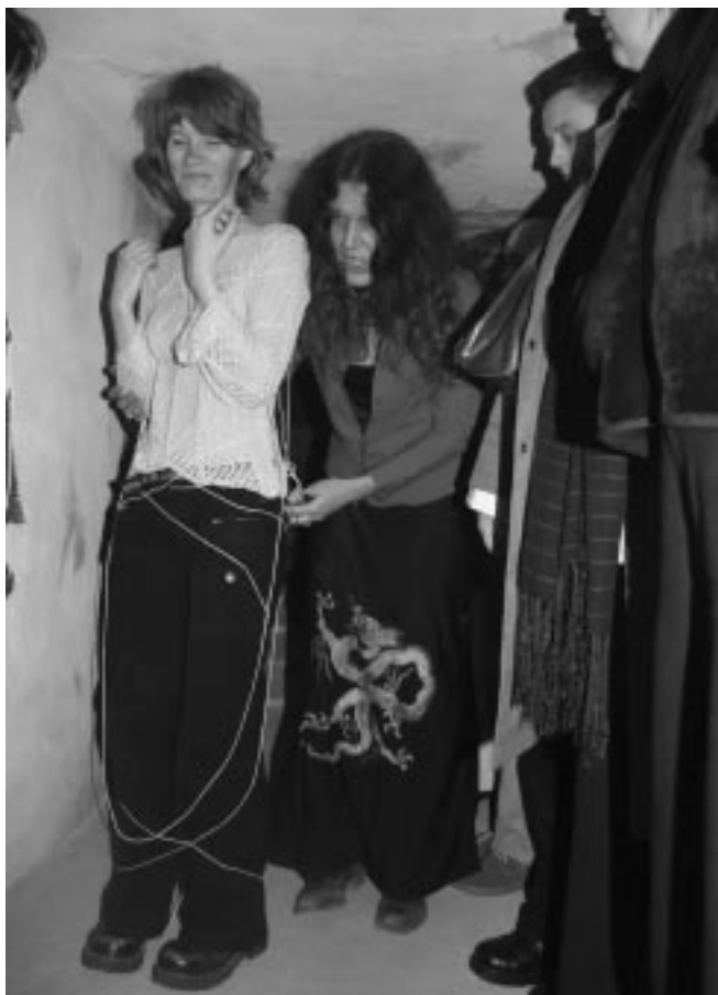
Performance z udziałem publiczności pt. „Minotaur”.