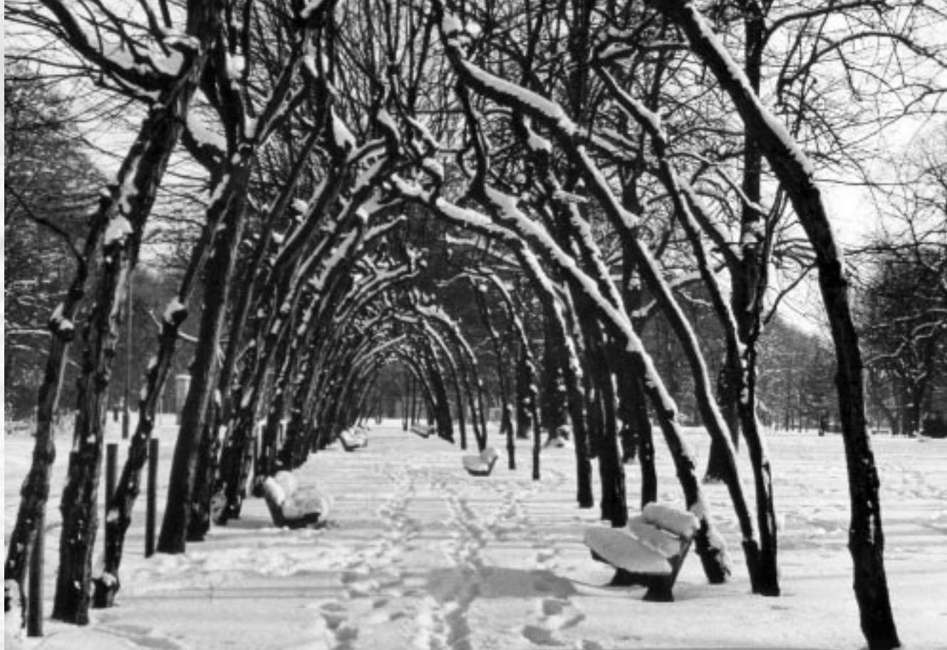
Zimowy szpaler (1987).

Stanisław Sudnik wprowadzał do swojego środowiska twórczy ferment intelektualny. Następne pokolenie zrealizowało te uświadomione i te nieświadomione projekty. Fotografia w Ostrowcu Świętokrzyskim osiągnęła znakomity poziom, a kolejne manifestacje środowiska potwierdzają wysoką pozycję Ostrowca w ścisłej czołówce środowisk fotograficznych w naszym kraju. Z mocą należy podkreślić, że ostrowiccy są w pełni przygotowani do samodzielnego funkcjonowania. Z wiarą i nadzieją oczekuję na utrzymanie tej pozycji oraz na dalszy „rozkwit twórczości fotograficznej w grodzie nad Kamienną” (cytat z autorskiego tekstu wstępu do katalogu wystawy „Grupa Pięciu”, Ostrowiec Świętokrzyski 1984)