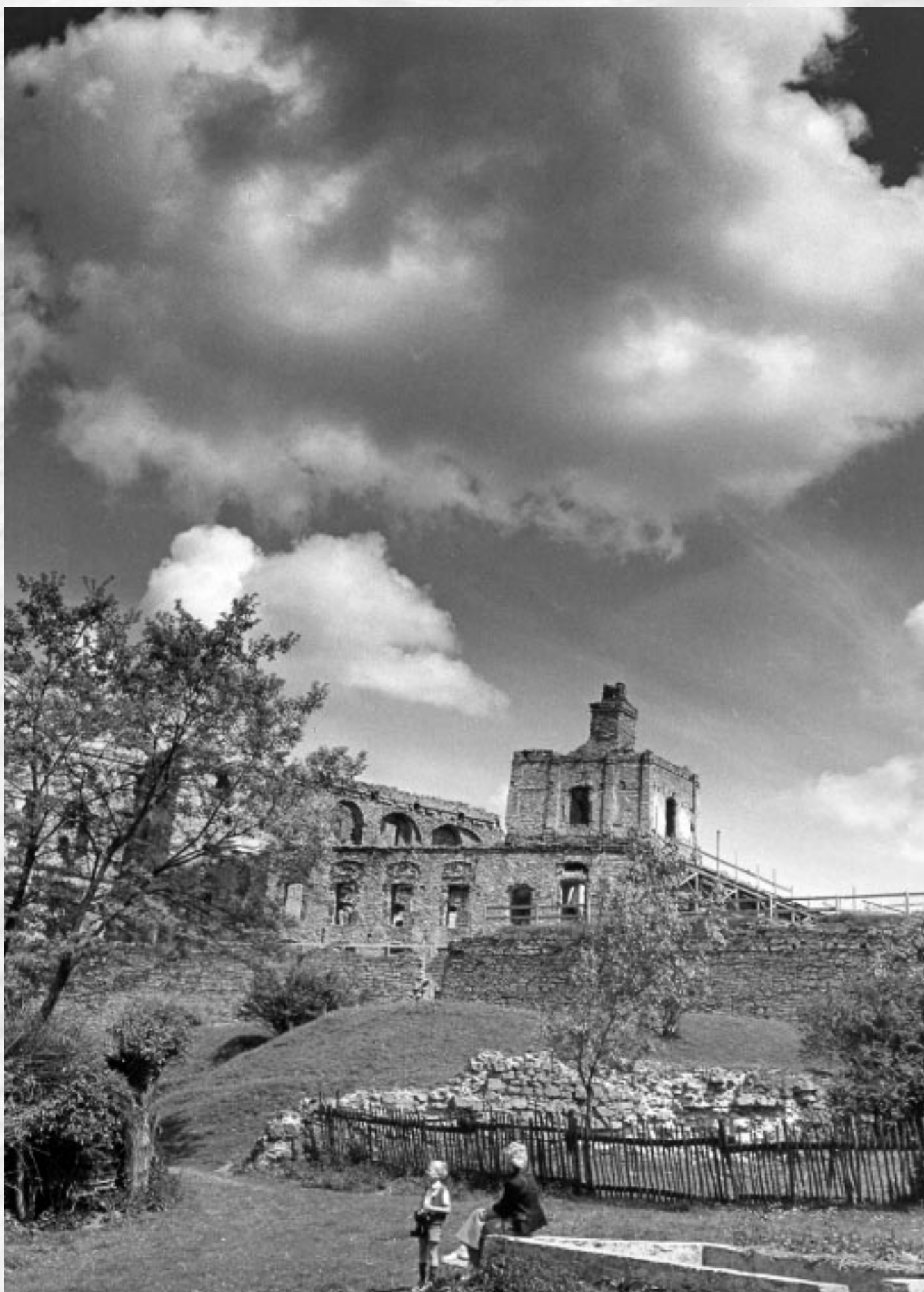
Krzyżtopór. Zamek w Ujeździe (1971).