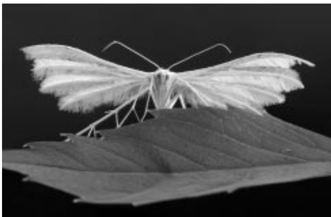
Aniołek wśród owadów