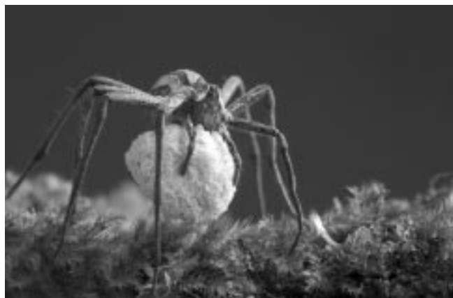
Darownik przedziwny z kokonem młodych