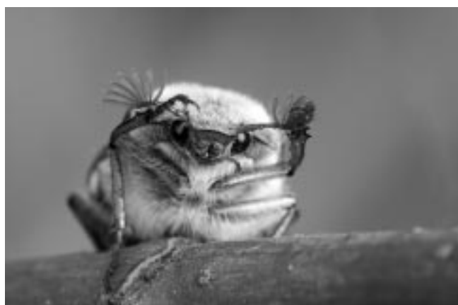
Kropek (chrabąszcz majowy)