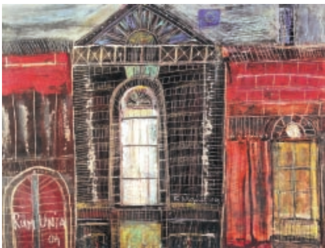
Krzysztof Mańczyński – zestaw obrazów z cyklu „RumUnia” – Nagroda Zespołu Państwowych Szkół Plastycznych w Kielcach