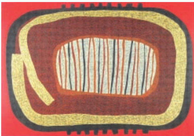
Andrzej Rachoń – zestaw obrazów z cyklu „Megality” – Nagroda Burmistrza Sandomierza