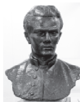
Muzeum Lat szkolnych Stefana Żeromskiego