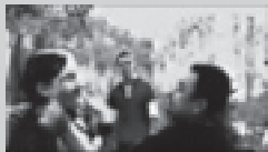
„Hobby” (reż. Dariusz Nojman) - seans THE BEST OF OSKARIADA FILM FESTIVAL (listopad 2004)