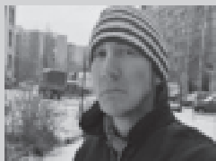
„Krew z nosa” (reż. Dominik Matwiejczyk) - seans KREW Z NOSA (grudzień 2004)