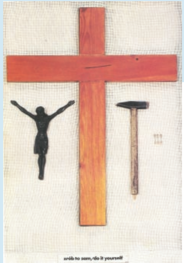
Eugeniusz Get-Stankiewicz „Zrób to sam”

Cel wyznaczała wyobraźnia, był on lokowany wysoko i poza, do niego dążono, ale jego osiągnięcie pozostawało nieustająco niespełnialnym pragnieniem, metafizyką. Osłodę trudu szukania dawało chwilowe przynajmniej zanurzenie się w radościach codzienności.