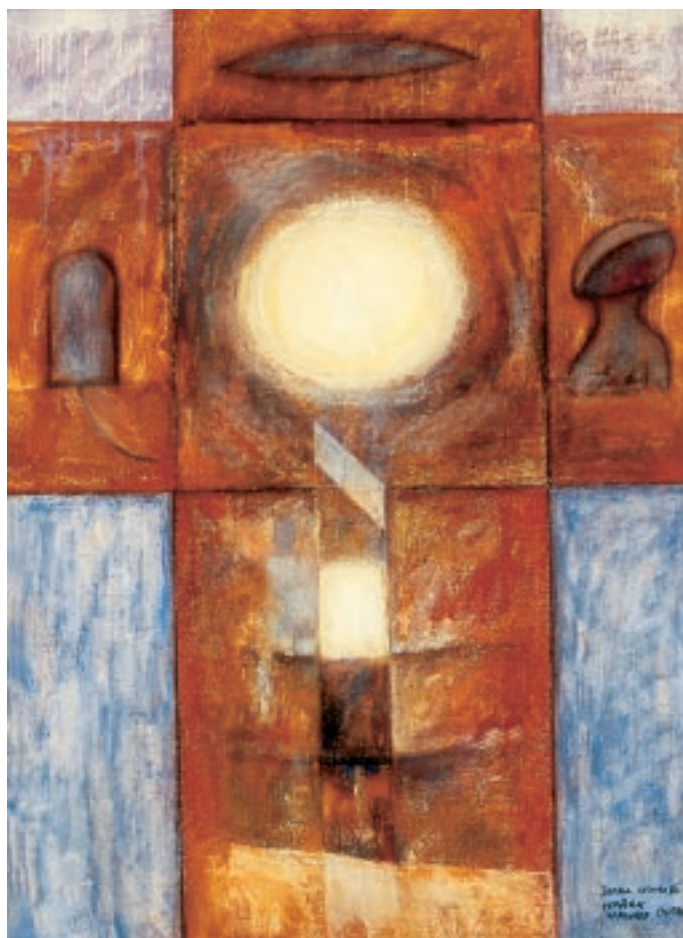
Marek Wawro „xxx”

artyści możemy odnajdywać duchowy realizm przedstawiania religijnych wartości, ich wcielenie w formy z profanum, z potoczności naszego życia wzięte. Wyraziste i wysokiej rangą artystyczną malarstwo to dodatkowo sankcjonuje prawdziwość autorskiej drogi twórczego poszukiwania. Patrząc na publiczne muzealne pokazy malarstwa współczesnego, z zadziwieniem konstatujemy, że nikt tak monumentalnie, jak M. Czapla, nie wcielił idei sacrum w materię sztuki i nie podniósł profanum do rangi sacrum mocną i gęstą materią malarską, pozostając wierny figuratywności.