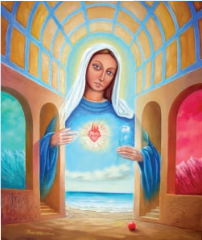
Edo Tuz „xxx”

Pojęciem sacrum określa się zazwyczaj to, co święte (z łaciny sacer - święty). Jest to podstawowa jakość i kategoria wszelkich religii pozwalająca odróżnić i oddzielać je od wszystkiego, co świeckie. Potocznie sacrum utożsamia się z tym co religijne, ale na terenie sztuki takie definiowanie nie jest zasadne, albowiem sztuka religijna jest zawsze związana z określoną religią i powinna być zgodna z jej doktryną. Sztuka dotykająca sacrum może wymykać się poza schemat doktryny i zazwyczaj bywa otwarta na nowe myślenie i widzenie a religijne sacrum jest dla niej, chociaż nie zawsze, tylko inspiracją, tworzywem, ale też finalnym sensem nie dającym się dookreślić w sposób zgodny z jakkolwiek religią. Tego typu zjawiska artystyczne określa się jako irreligijne mianem antysztuki.