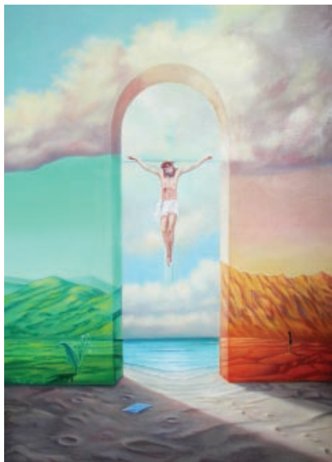
Edo Tuz „xxx”

wtórnej naiwności . Miał świadomość nierozumienia języka sztuk wizualnych, pisząc „O duchowości w sztuce” (1911 r.). Nie przewidział, że obecnie w naszym życiu codziennym, dla naszego własnego bezpieczeństwa, ważniejszy jest język subkultur aniżeli podstawy języków różnych dziedzin sztuki współczesnej. Może dlatego stajemy bezradni wobec naturalistycznego wizerunku Papieża przygniecionego rzekomym meteorytem