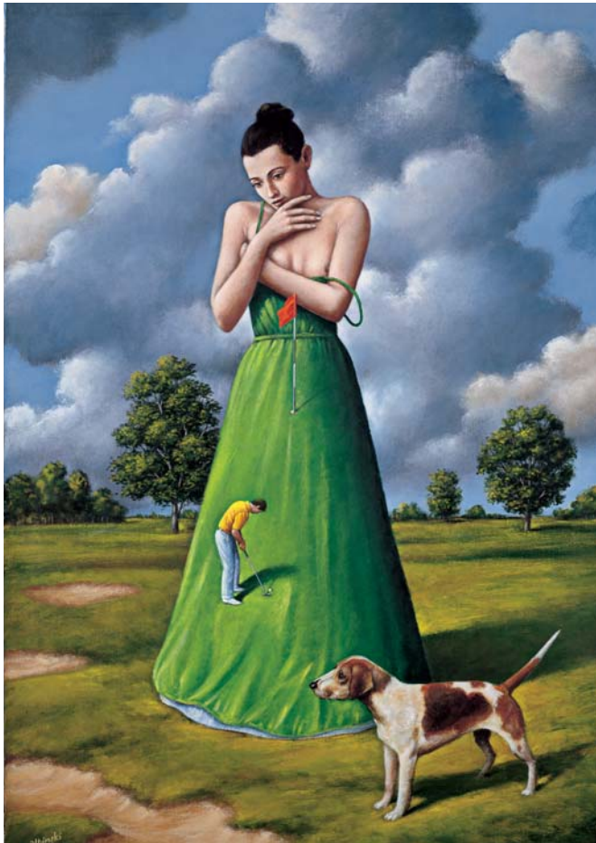
„Kobieta w zielonym”