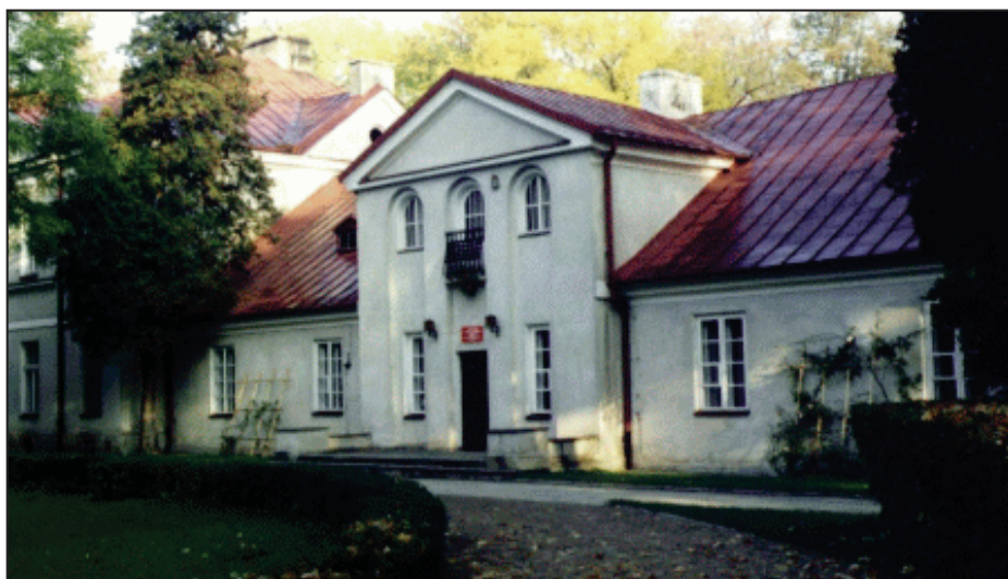
Dwór Dembińskich w Przysusze - Muzeum Oskara Kolberga

W mieszkaniu Kolbergów bywali przedstawiciele artystycznego i literackiego środowiska ówczesnej Warszawy (m. in. M. Chopin, S. B. Linde, K. Brodziński) co na pewno wywarło wpływ na młodego Oskara. W kształtowaniu charakteru chłopca sporo poczyniła szkoła (Liceum Warszawskie 1823-30), lekcje muzyki w zakresie kompozycji i gry na fortepianie, klęska Powstania Listopadowego oraz śmierć ojca w 1831 roku. Siedemnastoletni młodzieniec podjął pracę zarobkową w banku nie zaniedbując kształcenia muzycznego. W tym też kierunku kontynuował studia w Berlinie (1835-36) ucząc się jednocześnie księgowości w Akademii Handlowej. Po powrocie, za wstawiennictwem przyjaciół rodziny, pracował jako prywatny nauczyciel gry na fortepianie w arystokratycznych domach w Mitawie, Wilnie, Homlu, Białymstoku i w Warszawie. W tym czasie, jako autor haseł z dziedziny muzyki muzykologii, rozpoczął współpracę z Encyklopedią powszechną S. Orgelbranda. Przez szesnaście lat był księgowym w Zarządzie Drogi Żelaznej Warszawsko-Wiedeńskiej (do 1857) oraz w Dyrekcji Dróg i Mostów (do 1861), następnie starał się utrzymywać wyłącznie z pisarstwa i lekcji muzyki.