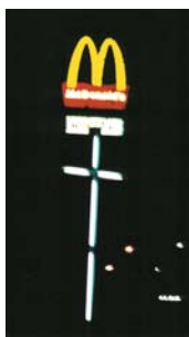
„Sacrum i profanum”

Wernisaż wystawy pokonkursowej odbędzie się 17 października 2005 w Kieleckiej Galerii Fotografii o godz. 18.00 . Wystawa potrwa do 6 listopada 2005, a w terminach późniejszych, będzie także prezentowana w innych galeriach, o czym z pewnością poinformujemy Naszych Czytelników. Już dzisiaj natomiast gorąco dziękujemy wszystkim uczestnikom za swoje zgłoszenia, a naszym partnerom medialnym i sponsorom za okazane wsparcie przy organizacji i promocji Konkursu. Więcej informacji o wynikach Konkursu oraz galerię wszystkich nagrodzonych i wyróżnionych prac zamieścimy w kolejnym numerze „Dedał” oraz specjalnym katalogu wystawy i na stronie www.dedal.info.pl