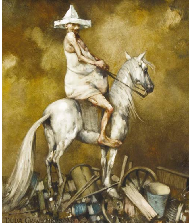
„Motyw polski – oczekiwanie 2”, olej, 1994.

Jerzy Duda Gracj (1941-2004), artysta malarz, ukończył studia na Wydziale Grafiki Akademii Sztuk Pięknych w Krakowie – Filia w Katowicach (1968), a następnie był wykładowcą i docentem w macierzystej uczelni (1976-82); w czasie stanu wojennego został odsunięty od pracy dydaktycznej; od 1992 był profesorem malarstwa w Uniwersytecie Śląskim w Katowicach i w Europejskiej Akademii Sztuk w Warszawie. Jego twórczość obejmuje cykle malarskie: „Obrazy i portrety polskie” (1968-80), „Motywy polskie, pejzaże polskie” (1980-83), „Obrazy jurajskie” (1984-90), „Obrazy arystokratyczno-historyczne” i „Obrazy prowincjonalno-gminne” oraz ostatni cykl Chopinowski. Za wybitne osiągnięcia artystyczne został odznaczony Krzyżem Wielkim Orderu Odrodzenia Polski (2000) oraz wyróżniony wieloma nagrodami, m.in. Nagrodą Ministra Kultury i Sztuki (1985) i Ministra Spraw Zagranicznych (1988). Prace Jerzego Dudy Gracza znajdują się w zbiorach Muzeum Narodowego w Krakowie, Warszawie, Gdańsku i Poznaniu, Muzeum Śląskiego w Katowicach, Muzeum Sztuki w Łodzi, Muzeum Uffizi we Florencji, Muzeum Watykańskiego oraz w kolekcji malarstwa na Jasnej Górze w rodzinnej Częstochowie. Pośmiertną wystawę prac Jerzego ze zbiorów prywatnych, pod znanym tytułem „Pro Memoria”, można było oglądać w Muzeum Miejskim we Wrocławiu, w Muzeum Miedzi w Legnicy i w Muzeum Śląskim w Katowicach.