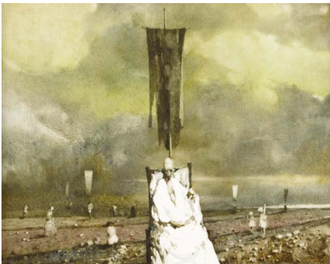
„Cykl Jurajski”, olej, 1984.