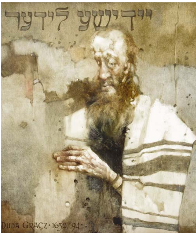
„Próba rekonstrukcji”, olej, 1994.