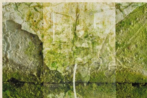
Z cyklu „Przemijanie”.