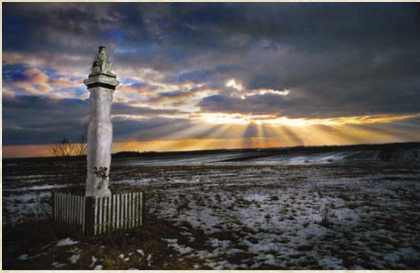
„Frasobliwy na Ponidziu”.