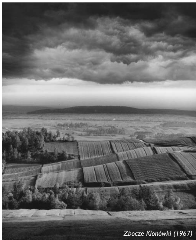
Zbocze Klonówki (1967)