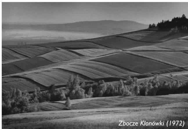
Zbocze Klonówki (1972)

– Tak, jak przystało na inżyniera, zgłębiałem tajniki fotografii metodycznie. Próbowałem wszystkiego i we wszystkich tematach odniosłem sukcesy. Zostałem jednak przy krajobrazie. W pejzażu mogłem wypowiedzieć własne wnętrze. Na zdjęciach ludzie pojawiają się tylko jako dodatkowy element, sztafaż wyznaczający ludzki wymiar świętokrzyskiej przestrzeni. Najważniejsze były struktury krajobrazowe, geometria, która w naszym krajobrazie pojawia się bardzo często. Na początku była to sinusoida. Zapadła mi także w pamięć geometria poletka, które się ukazało na podobieństwo ludowego dzbana ilżeckiego. Piękne są takie spotkania w krajobrazie form, one właśnie poruszają człowieka. ►