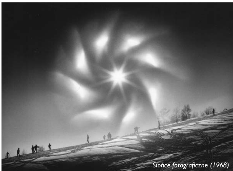
Słońce fotograficzne (1968)