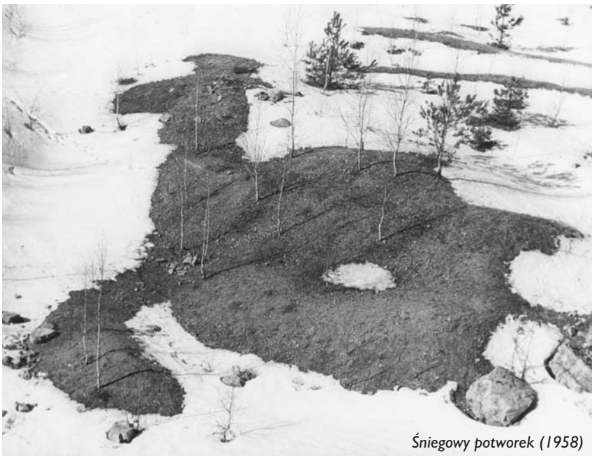
Śniegowy potworek (1958)

– Dziękuję serdecznie za spotkanie i rozmowę. ■