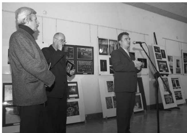
Otwarcie wernisazu w Buskim Samorządowym Centrum Kultury.