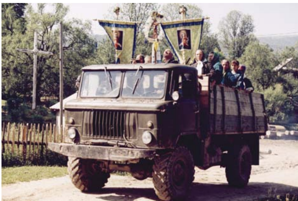
Wyróżnienie – Andrzej Szczerbicki (Ustrzyki Dolne) – „Wyjazd na odpust”.