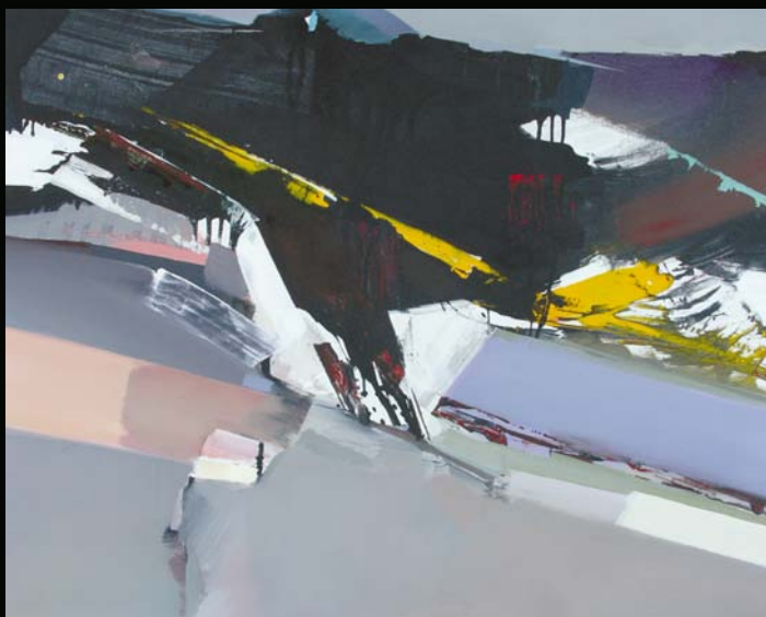
Ponure kadry PRL