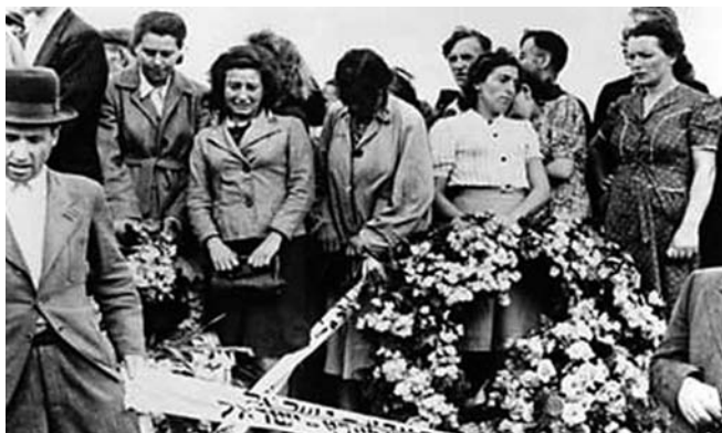
Placz bliskich nad trumnami ofiar zbrodni (8 lipca 1946 r.).

– W momencie kiedy zacząłem publikować najpierw artykuły obszernie w prasie niewelicowej a potem wyszła moja książka, nieoczekiwanie pojawiło się słowo „prowokacja”, przy czym nie wyjaśniono, kto był tym prowokatorem, kto był sprowokowany i dlaczego. Ale to stwierdzenie pasuje do głównego scenariusza wydarzeń, gdyż właśnie przejście grupy milicjantów, prowadzących „uratowane” dziecko, zrobione było po to, by sprowokować wydarzenia, później twierdzić, iż okrzyki wydawane przez tych milicjantów były prowokacją. Ci sami milicjanci wrócili potem pod dom na Plantach i zastali drzwi i drewniane okiennice na parterze zamknięte. Dali hasło do rozpoczęcia ataku, wrzucając granat przez okno pierwszego piętra oficyny, która miała być poddana atakowi. Potem napływające oddziały różnej proveniencji zapełniły podwórko od strony południowej, gromadząc się przy jeszcze zamkniętym wejściu do oficyny, a także na ul. Planty – bardzo wąskiej, nad którą przejęli całkowitą kontrolę,