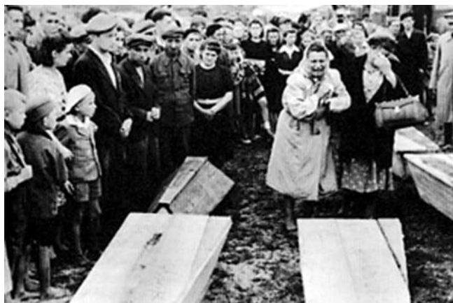
Pogrzeb ofiar zbrodni (8 lipca 1946 r.).

– Jeśli w III RP przygotowano obrzydliwy atak na niezłomne miasteczko Jedwabne, a niezłomne dlatego, że nie udało się tam umieścić ani jednego agenta, ani przez Gestapo, ani Urząd Bezpieczeństwa, który poniósł klęskę, nie mogąc zwerbować tych, na których mu zależało, panowie z „Instytutu Niepamięci Narodowej” w Białymstoku pojechali do zbrodniarza nazistowskiego, który morderstwem na Żydach w Jedwabnem kierował, z prośbą, by potwierdził, że zrobili to Polacy. Dla nazisty, na koniec jego życia było to satysfakcjonujące uwolnienie się od zarzutu zbrodni. Druga część oskarżenia w Jedwabnem