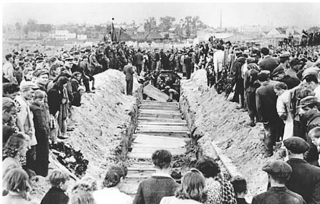
Zbiorowa mogiła ofiar zbrodni (8 lipca 1946 r.).

Jeśli oddziały KBW, ówczesnego WP, ochrony gmachów UB, funkcjonariuszy UB – w mundurach i po cywilnemu – będziemy traktowali jako oddziały polskie, będzie to poważny błąd. Byli to, zgodnie z powszechnym prawem wojennym także akceptowanym przez Polskę, najmici – bez względu na to, czy zwerbowani i powołani pod groźbą wyroku śmierci, są oni kondotierami.