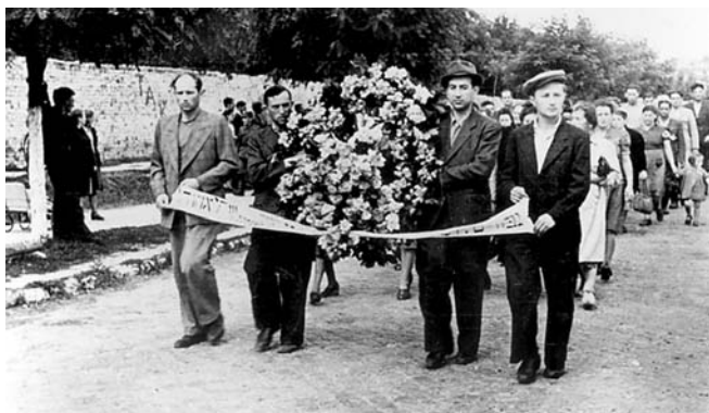
Marsz pogrzebowy za trumnami ofiar zbrodni (8 lipca 1946 r.).