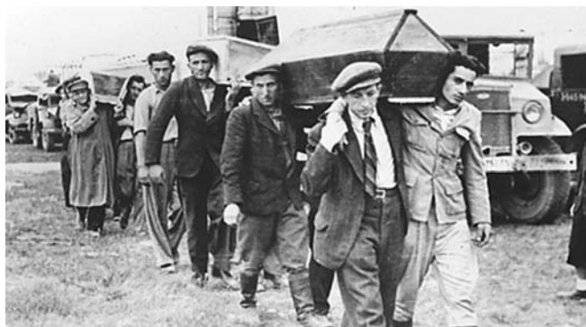
Kondukt pogrzebowy ofiar zbrodni (8 lipca 1946 r.).