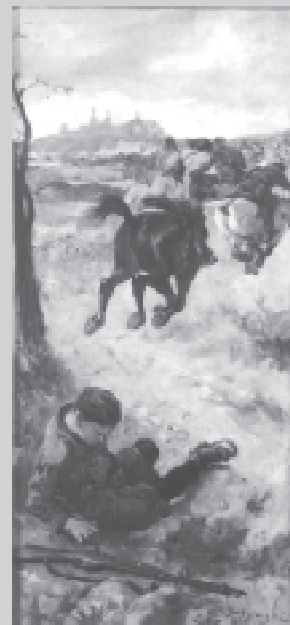
S. Kaczor - Batowski, Obrońcom Płocka , 1935, Muzeum Wojska Polskiego w Warszawie; fot. ze zbiorów A. Myślińskiej.

„Obrońcom Płocka” (1935) i „Obrona Lwowa” (1936), przedstawione przez Batowskiego w równie monumentalnej co „Tryptyk Kielecki” formie, pokazywały młodzieży uczącej się w Szkole Powszechniej im. I Marszałka Polski Józefa